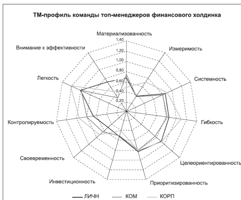
Рис.1 - ТМ-профиль команды топ-менеджеров.

Профиль строится на основе данных, полученных от анкетирования команды менеджеров по трем основным направлениям внедрения тайм-менеджмента в компании: