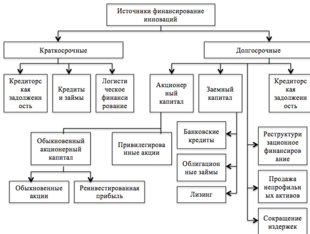
Рисунок 1 – Источники финансирования инновационной деятельности предприятий [4, с. 105].

К основным стратегическим партнерам инновационно активных предприятий относятся их поставщики и покупатели - предприятия и организации, напрямую заинтересованные в тех новых продуктах и технологиях, которые должны появиться в результате внедрения инновационных проектов.