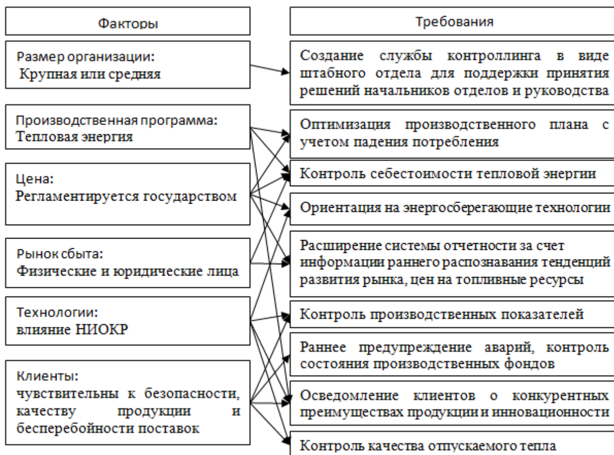
Рисунок 2 - Взаимосвязь факторов и требований к инструментам контроллинга

На основании требований, были выбраны инструменты контроллинга и сфера их применения, описанные в таблице 1.