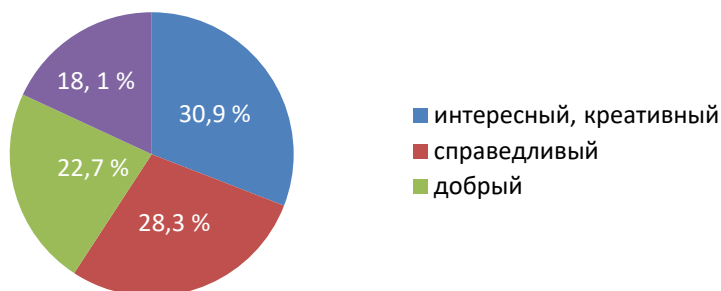
Рисунок 1 Диаграмма распределения ответов на вопрос «Основные качества, которые бы Вы хотели видеть в кураторе группы»

Нами было проведено анкетирование среди обучающихся 1,2 курсов БашГАУ. На рисунке 1 представлены данные- качества куратора, которые выделили обучающиеся при анкетировании.