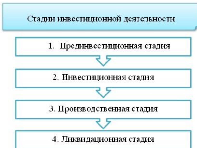
Рис. № 1. Стадии инвестиционной деятельности

Каждая стадия инвестиционной деятельности направлена на совершение определенных действий, таких как, подготовка к инвестированию (определение инвестиционных возможностей, анализ наиболее эффективного проекта инвестирования, принятие решения об инвестировании), составление планов и инвестиционных проектов на основе полученной информации, осуществление реального производства и фактического использования инвестиций (закупка сырья, оборудования, производство и сбыт продукции).