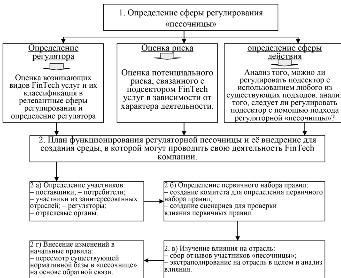
Рис. 1. – Процессная модель создания регуляторной «песочницы».

Учитывая проанализированные структурные элементы регуляторной «песочницы» и существующую универсальную модель её операционного процесса представим структурно-рекомендательную модель создания регуляторной «песочницы», которая будет способствовать созданию отечественным регулятором эффективной регуляторной «песочницы» (рис. 1).